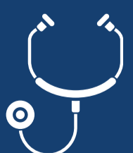
Tavola Rotonda: Ruolo Unico e Riforma Schillaci

Ruolo unico: evoluzione o snaturamento della MG?